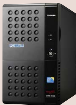
サーバーは信頼性に優れたインテル®Xeon®プロセッサ X3330搭載

※Intel、インテル、Intel ロゴ、Intel Inside、Intel Inside ロゴ、Xeon、Xeon Insideは、アメリカ合衆国およびその他の国におけるIntel Corporationの商標です。