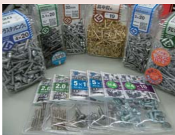
ホームセンターなどで見かけるネジ商品

会社概要 株式会社八幡ねじ 愛知県北名古屋市山之腰天神東18 創業：1946年(設立1953年) 従業員数：245名(グループ計984名) 事業内容：ネジ製品および機械加工製品の製造販売。タイと上海に製造・販売の現地法人を持つ。 URL: http://www.yht.co.jp/