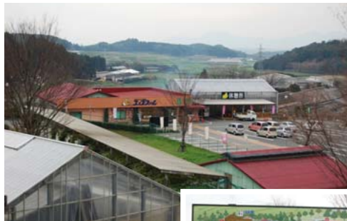
平坦な土地ではなくいわゆる「中山間地」にある。この起伏が来訪者には自然に親しめる場所という付加価値を提供している。敷地内には無料休憩所などもある